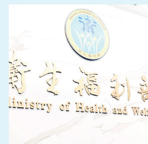
Ministerio de Salud y Bienestar Social

Chiu Yi-ying resaltó que estas leyes permiten avanzar en la biotecnología más allá de los