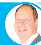
OPINIÓN ISAAC BIGIO

En Cancillería ¿dejan que un no diplomático, más bien un especialista en negocios, los lleve de la nariz en la embajada más importante del Perú en el extranjero, Washington DC?