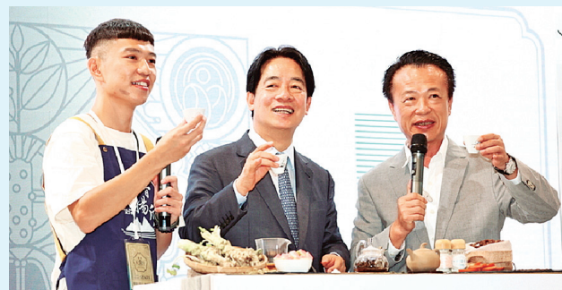
Presidente Lai Ching-te en la Feria Gastronómica.

Además, el presidente Lai señaló que la gastronomía local de Taiwán no solo posee un rico valor cultu-