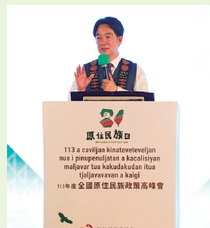
Presidente Lai Ching-te en el Día de los Pueblos Aborígenes

Lai delineó cinco direcciones principales para la política futura hacia los pueblos indígenas. Primero, se enfocará en la revitalización de los idiomas propios, destacando la importancia de que todos los grupos étnicos puedan hablar sus lenguas maternas. Segundo, se centrará en mejorar la