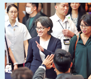
Hsiao Bi-khim saluda a los asistentes al oro de Gobernanza de Internet de Taiwán

La vicepresidenta destacó que, en la era digital, la gobernanza de Internet se ha vuelto crucial a nivel global. Como miembro de la comunidad mundial de Internet, Taiwán debe participar activamente para mejorar su competitividad digital y cumplir con sus responsabilidades y misiones internacionales. El enfo-