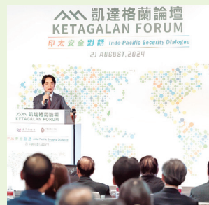
El presidente Lai Ching-te durante el Foro Ketagalan 2024.

Frente al creciente autoritarismo, Lai expresó que su Administración implementará el plan de acción de los Cuatro Pilares de la Paz para mante-