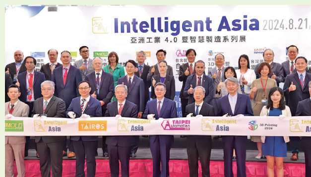
El primer ministro Cho Jung-tai (al frente, en el centro) participa en la ceremonia de apertura combinada de la Exhibición de Inteligencia y Robots de Automatización de Taiwán 2024 y la Exhibición de Automatización Taipéi 2024

Taiwán está a la vanguardia del desarrollo en industrias inteligentes y fabricación de hardware, al mismo tiempo que continúa avanzando en aplicaciones de software, indicó el primer