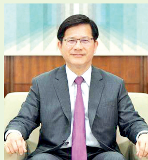
El ministro de Relaciones Exteriores, Lin Chia-lung.

En sus comentarios, el ministro indicó que China ha intensificado su intimidación militar contra Taiwán mientras utiliza la guerra cognitiva y las