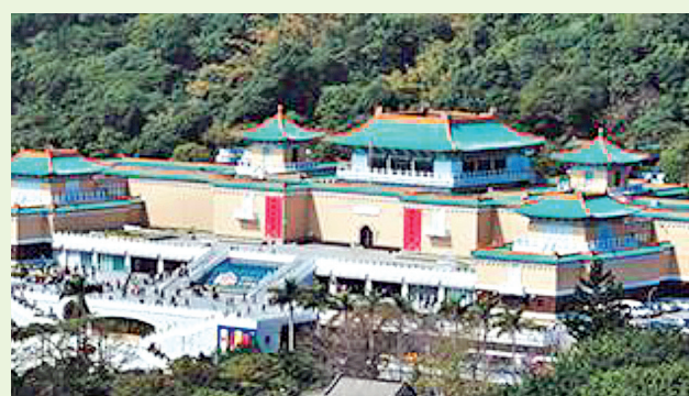
El Museo Nacional del Palacio es uno de los destinos principales para turistas extranjeros.

de los más antiguos, ahora conocido como el Museo Nacional de Taiwán, se inauguró en 1908 en Taipéi con un enfoque centrado en la historia natural de la colonia del imperio. Los museos de la nación ahora se cuentan por cientos y son una base firme sobre la cual la Oficina de Turismo del Ministerio de Transportes y Comunicaciones