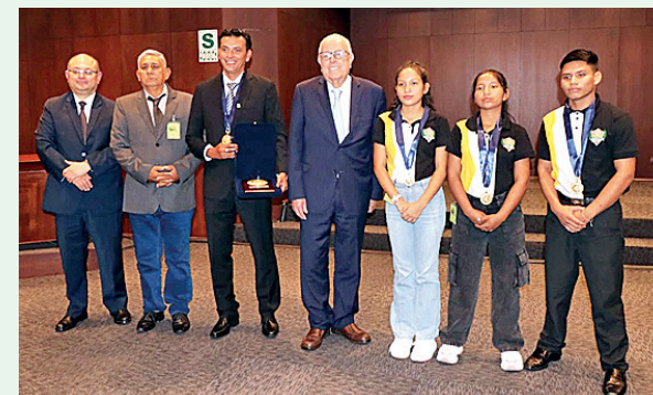
COLEGIOS DE LORETO, AYACUCHO Y LA LIBERTAD LOGRAN PRIMEROS PUESTOS

uso de pesticidas prohibidos (clorpirifó, paraguato y glifosato), la escasez de semillas certificadas y la contaminación del recurso hídrico por metales pesados. Los fenómenos climáticos y la especulación de precios también afectan la producción, reduciendo en un 35% los volúmenes en zonas clave como Barranca.